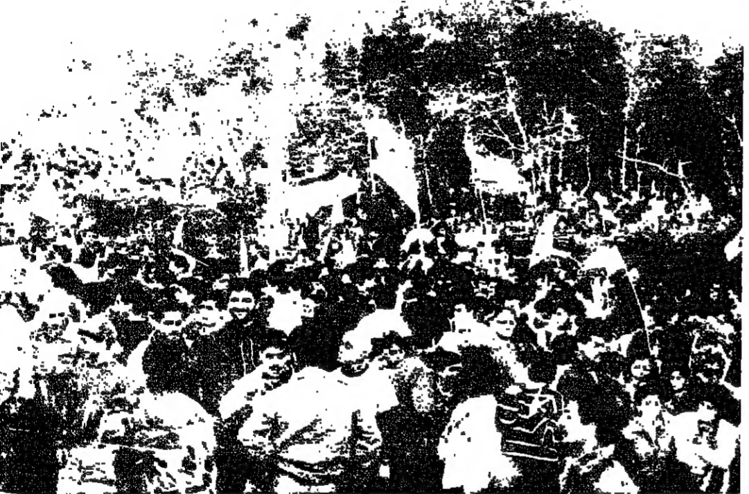
في المناطق المحيطة بالقصر اسس